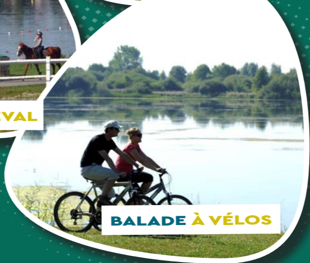
BALADE À VÉLOS