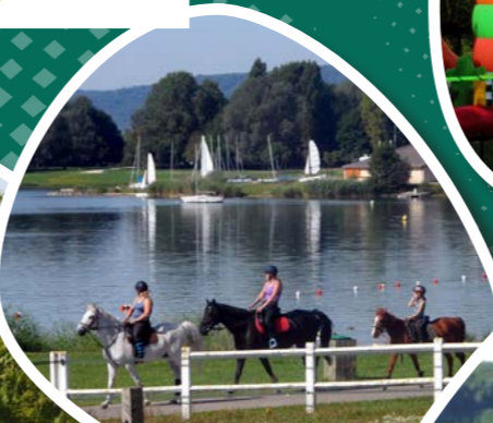
BALADE À CHEVAL